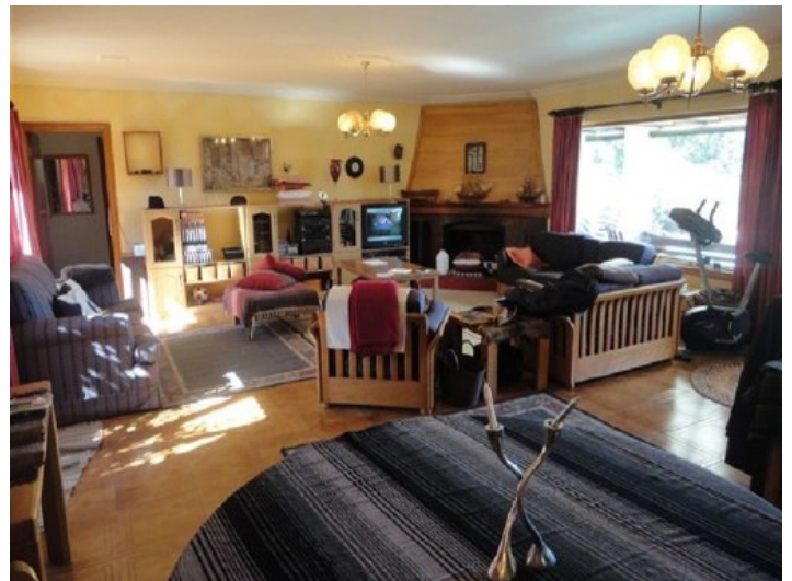
Geräumiges Wohnzimmer mit Kamin