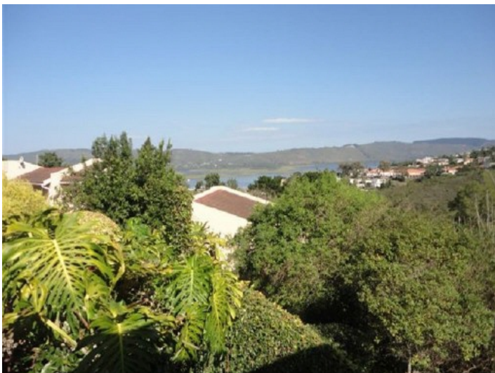
Blickauf die Lagune

Alle Angaben nach bestem Wissen. Irrtum und Zwischenverkauf vorbehalten. Dieses Exposé ist eine Vorinformation, als Rechtsgrundlage gilt allein der notariell abgeschlossene Kaufvertrag.